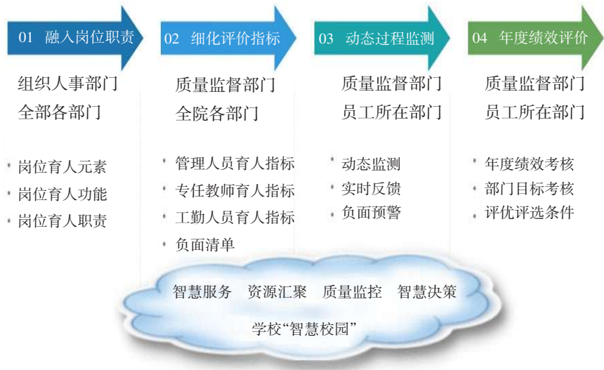
图1 “量化、动态、联动”的管理和评价模式

二是推进全方位融合育人行动。实施“课程思政”改革计划,制定《“课程思政”建设实施方案》,培育了一批充满思政元素、发挥思政功能的示范公共基础课和专业课引领“课程思政”改革,实现课程思政100%覆盖;重新梳理各部门岗位职责,提炼各岗位育人元素,将育人指标、育人成效纳入部门和个人年度绩效考核,实现育人成效与部门年度目标考核绩效奖励和个人绩效工资直接挂钩;实施了《大学生素质教育创新行动方案》,打造全方位、立体式的育人时空,形成素质修炼的“大熔炉”,给每个学生发放了素质“护照”,“护照”实行积分制,成为学生综合素质评定、获得毕业证书、评优评先、党员发展、毕业求职的重要依据。把培养社会主义合格建设者和可靠接班人落实到每一个细节之中,学校改办中专学校40余年,为我国铁路事业建设与快速发展培养了大量高素质技术技能人才。特别是2000年举办高等职业教